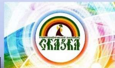
Хореографический Ансамбль «СКАЗКА»