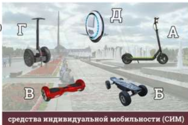
средства индивидуальной мобильности (СИМ)

ЦЕЛЬ: формирование у обучающихся знаний основных правил безопасного передвижения на электросамокатах, гироскутерах, сегвеех, моноколесах.