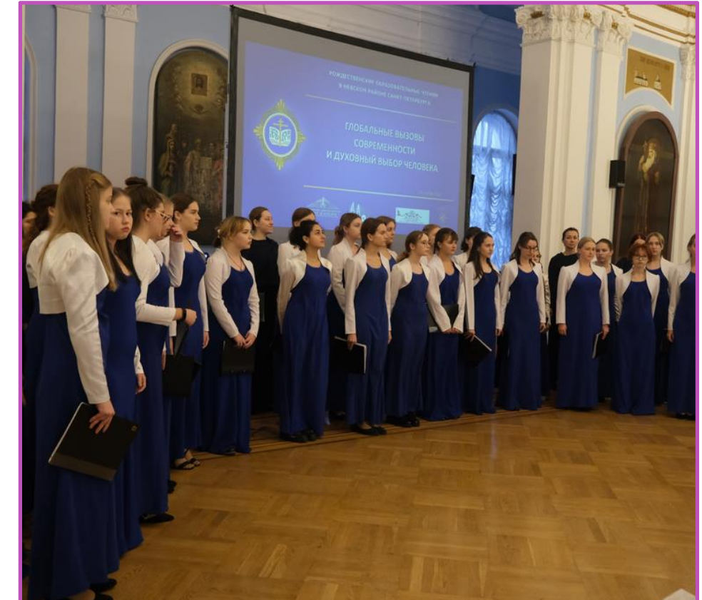
XXXI Международные Рождественские образовательные чтения «Глобальные вызовы современности и духовный выбор человека», 2022