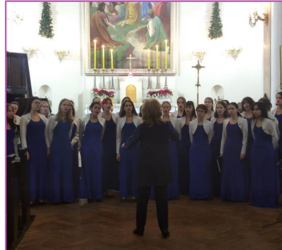
фестиваль духовной музыки «Ли́ки», 2023

Исполнение духовной музыки способствует духовно-нравственному воспитанию обучающихся и формированию уважительного отношения к культурным традициям России.