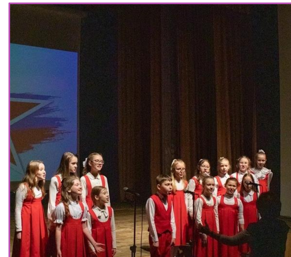
Концерт в честь Дня Защитника Отечества, 2024